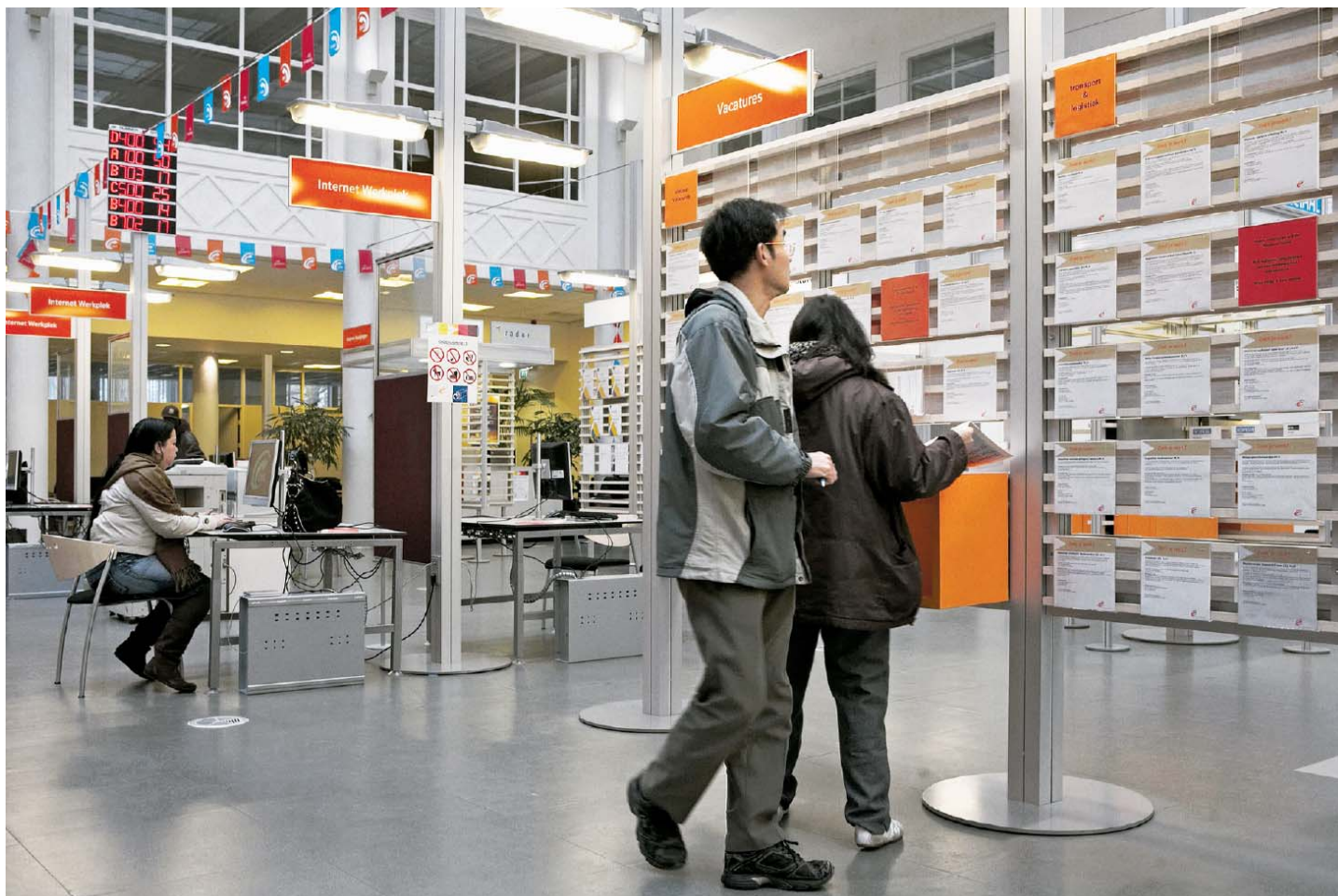
Centrum voor Werk en Inkomen in Rotterdam, waar voor mensen die een uitkering aanvragen het reïntegratietraject begint. In 41 procent van de gevallen zonder succes.

ject te volgen. Voor personen van 45 tot 54 jaar is de toegevoegde waarde van reïntegratie zelfs 0 procent.